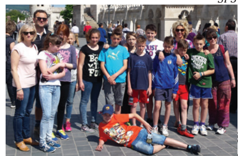
Reprezentacja „trójki” w Budapeszcie.