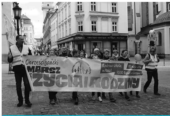
Marsz w Cieszynie odbył się po raz czwarty.