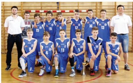
Trzymamy kciuki za młodych koszykarzy.

W dniach 6-8 maja w Białymstoku odbył się turniej ćwierćfinałowy. W pierwszym dniu zespół z Cieszyna rozegrał mecz z MOSiR Przeworsk, wygrywając 84:60. W drugim dniu cieszyniaczy zmierzyli się z drużyną UKS Chromik Żary, odnosząc drugie zwycięstwo 84:65 i tym samym gwarantując sobie udział w półfinałach Mistrzostw Polski. Ostatniego dnia turnieju drużyna młodzików starszych rozegrała mecz z gospodarzami, przegrywając 62:64. Najwię-