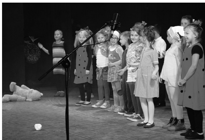
Do szczęścia niewiele trzeba – wystarczy wybrać się do teatru.