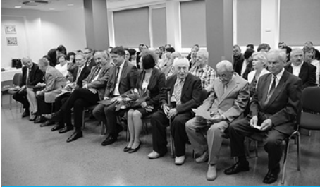
Uroczystości odbyły się w Szpitalu Śląskim.

25 lat i blisko 9 milionów złotych przekazanych na zakup aparatury ratującej życie pacjentów – tak można podsumować w liczbach działalność Fundacji Zdrowia Śląska Cieszyńskiego. Jubileuszowe obchody ćwierćwiecza, które odbyły się 13 maja w Szpitalu Śląskim w Cieszynie, były okazją do podsumowań.