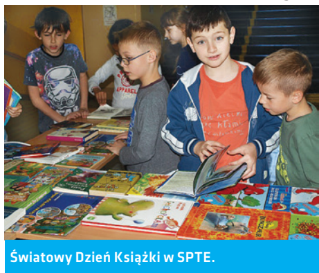
Światowy Dzień Książki w SPTe.