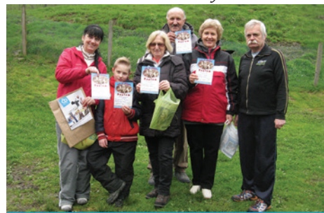
Dyplomy dla najlepszych strzelców.