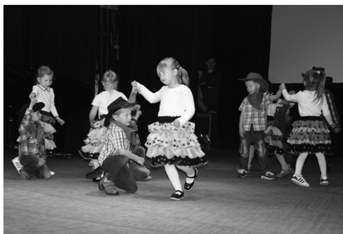
W akcji przedszkolaki z Pastwisk.