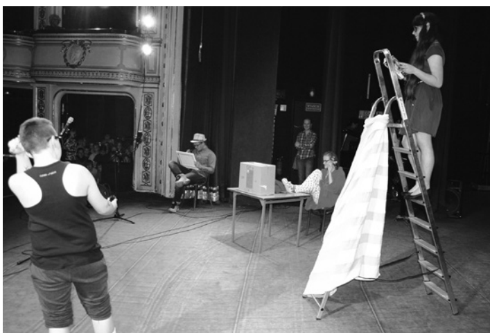
Uczniowski kabaret – na scenie Gimnazjum nr 2.