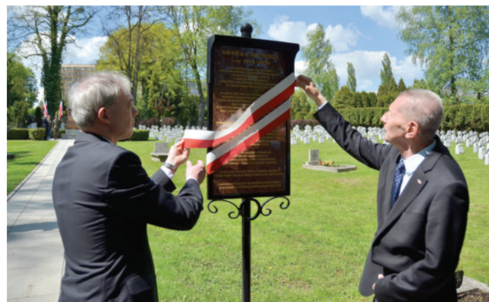
Symboliczne otwarcie kwatery wojskowej.

Na terytorium Rzeczypospolitej mamy w tej chwili 12 tys. obiektów grobownictwa wojennego, czyli grobów, kwater i cmentarzy wojennych. Dlatego ogromnie trudno jest powiedzieć, które robią największe wrażenie, dostarczają największych wzruszeń. Wszystkie powinny być otaczane pamięcią i szacunkiem. Czuję ogromną satysfakcję, że tu – w Cieszynie – połączył się wysiłek instytucji państwowej i samorządu lokalnego. To bardzo piękne i wzruszające miejsce, niosące z sobą ogromną porcję prawdziwej polskiej historii, zwłaszcza na obrzeżach państwa, bo te ziemi zawsze były poddawane najsilniejszemu opresjom przy każdym najeździe, przy każdej agresji czy wojnie, dlatego też odgrywają często bardzo ważną rolę. wot